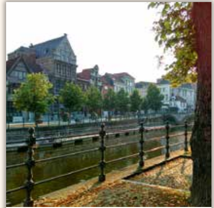
andrew_ewa #Street #City #Bridge #Canal #Water #Summer #2800love #Mechelen #Flanders #Belgium