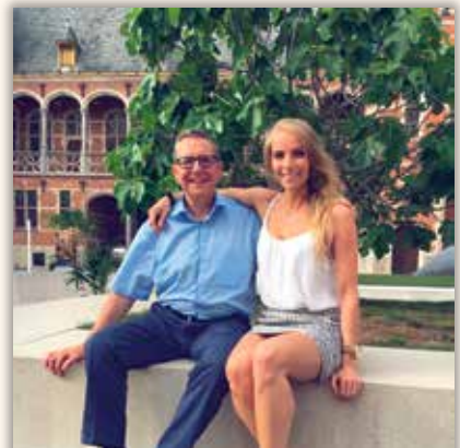
melissadenteneer Papa'tje in het land, da's altijd plezant 🍷 #mechelen #2800love #prettycity #hometown-glory #dad #sister #family #weekend #saturday