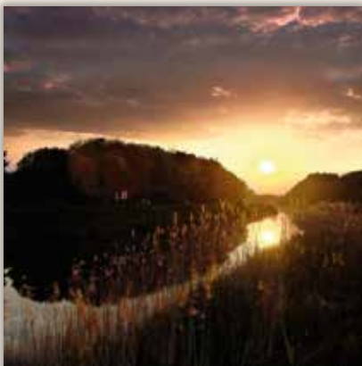
tony_mtx #tilesmalines the place to be in #mechelen #2800love