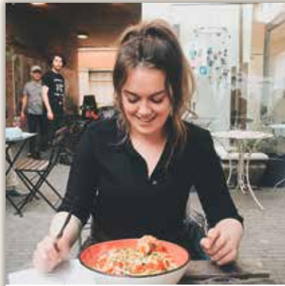
kanariepietje_ Food and good company makes me happy 🍷🍷 #student #2800love #italianfood #foodgram #summervibes

Jouw kans om iedereen te laten meegenieten van jouw unieke kijk op Mechelen en zijn Mechelaars.