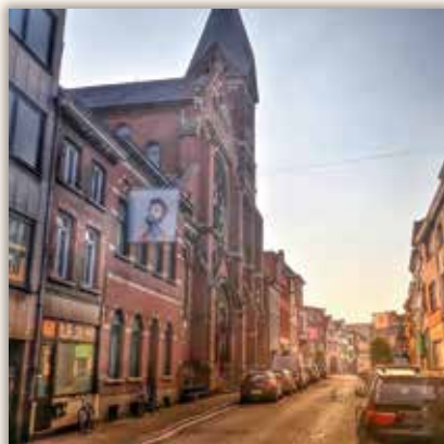
demecheleir Mechelse straten: Adegemstraat #visitmechelen #2800love #adegemstraat #deigemstraat #adegempoot