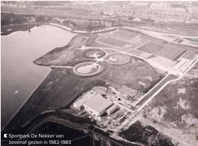
■ Sportpark De Nekker van bovenaf gezien in 1982-1983