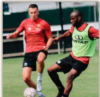
leen.vds @kvmechelen #mechelen #2800love #football #soccer #training