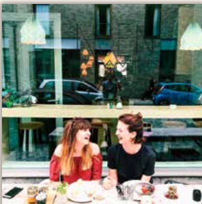
nouchka.andhercamera My sister by heart 🍷❤️ #nouchenjol #brunchladies #bestfriend #family #girls #girlpower #noen #2800love